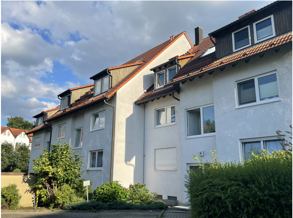
Gebäude - Rückansicht