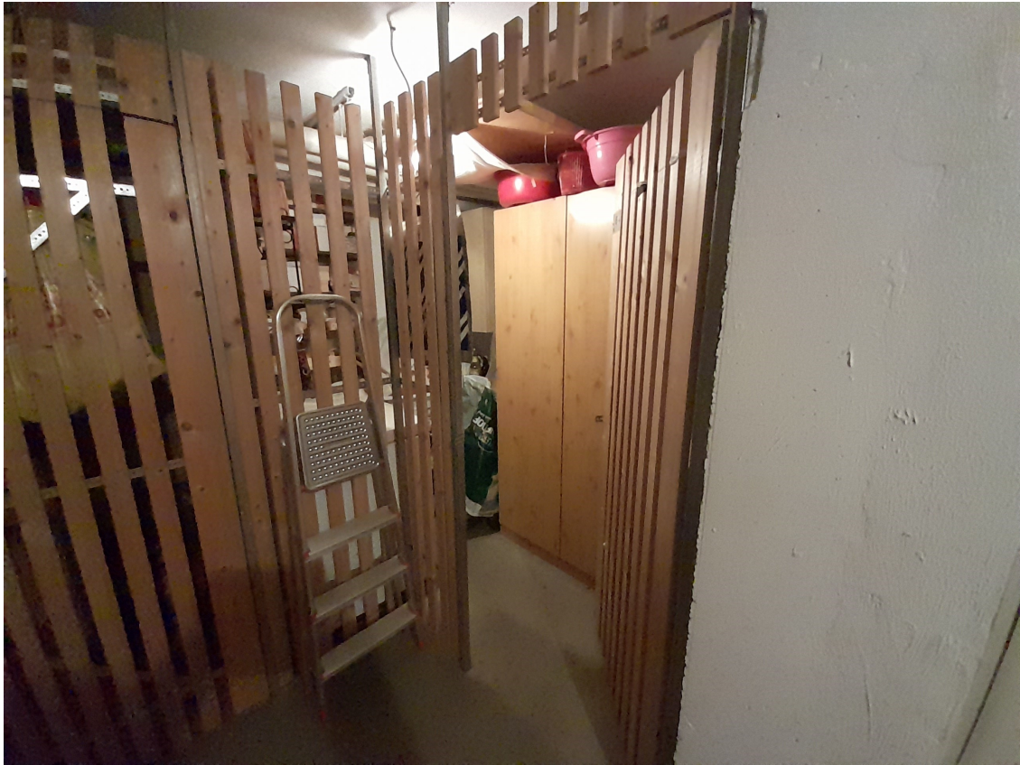
Gebäude - Ansicht Keller