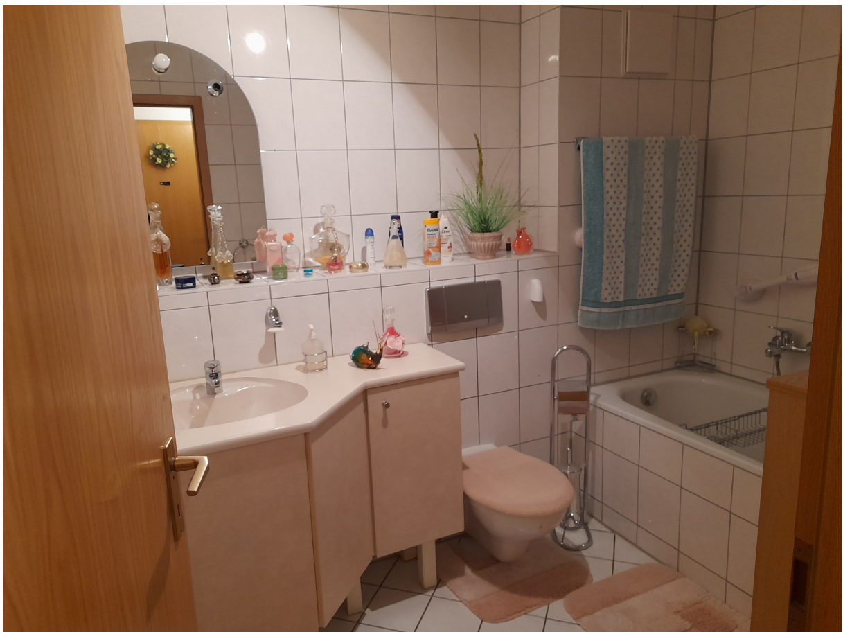
Wohnung - Ansicht Badezimmer / WC