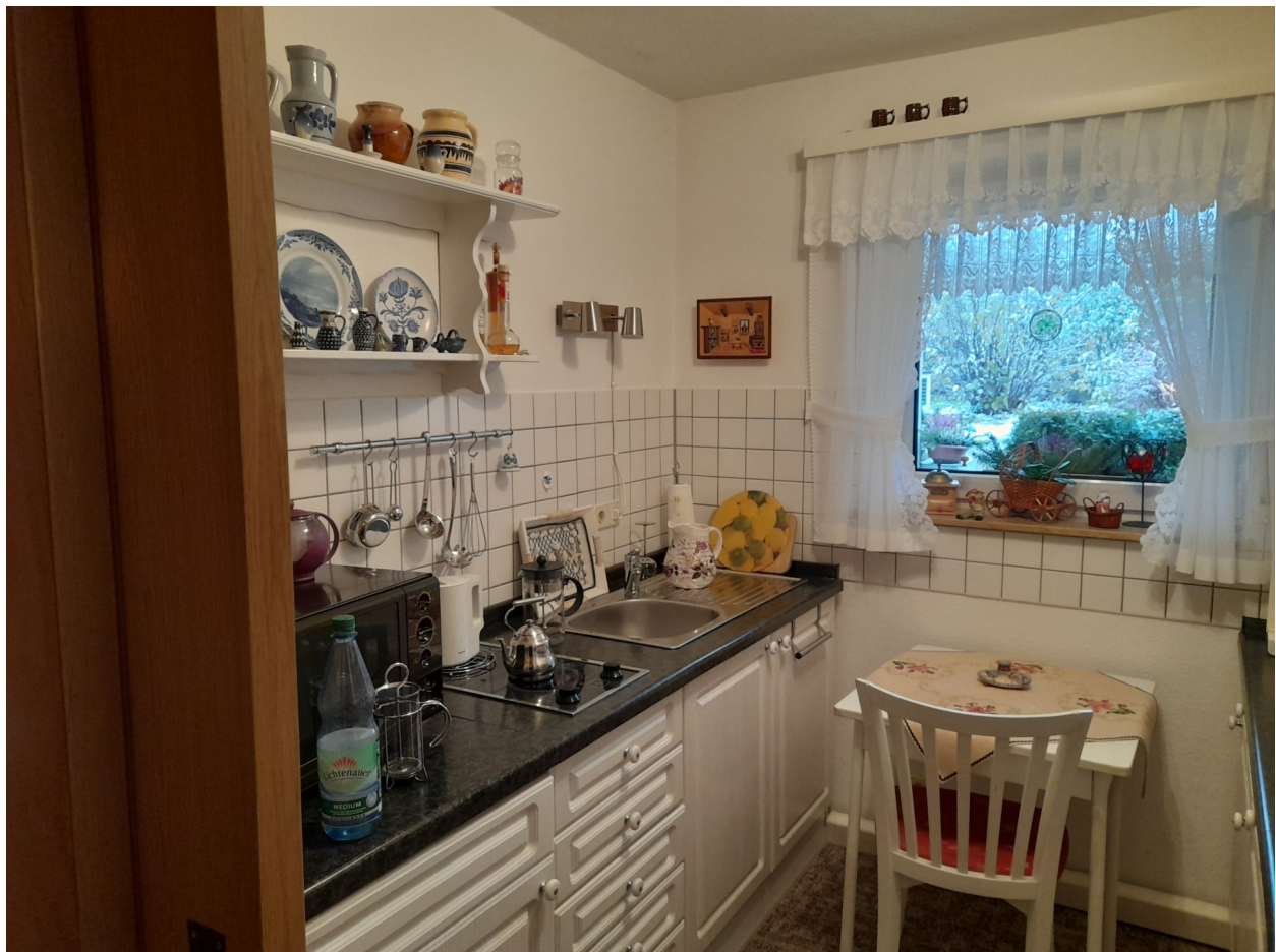
Wohnung - Ansicht Küche