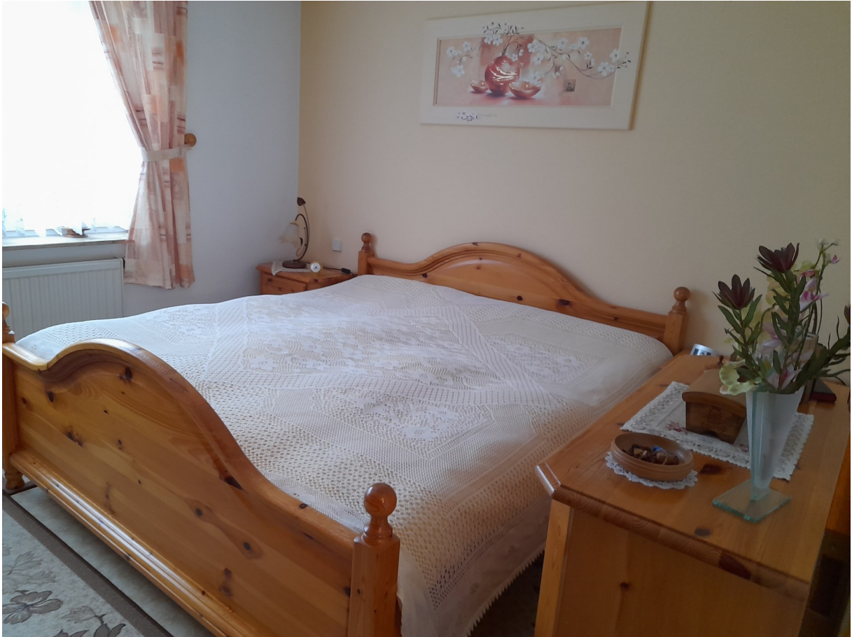
Wohnung - Ansicht Schlafzimmer