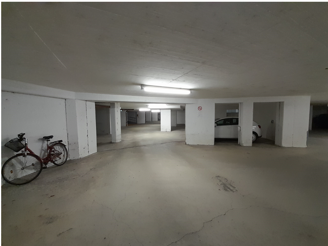
Gebäude - Ansicht Stellplatz (Tiefgarage)