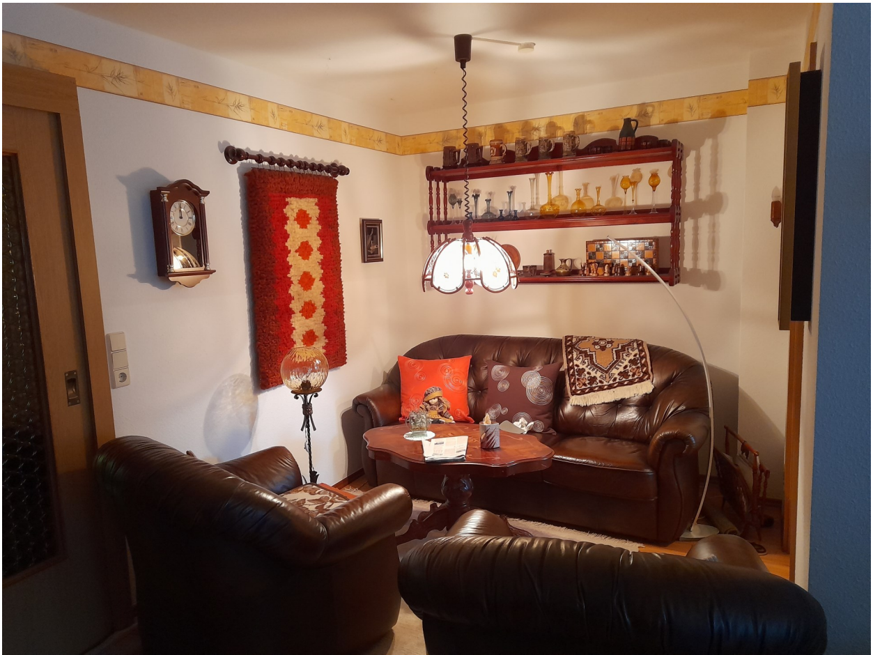
Wohnung - Ansicht Wohnzimmer