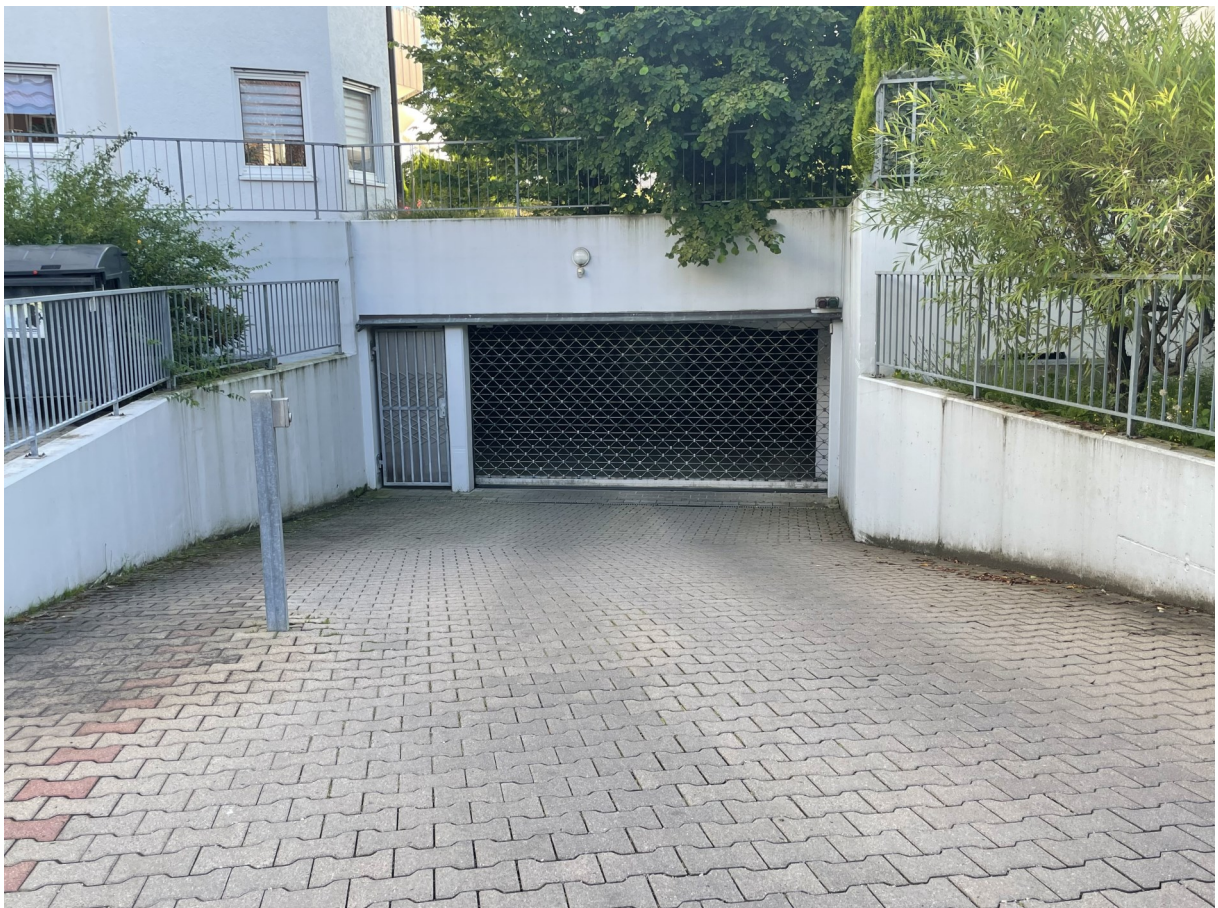
Gebäude - Einfahrt Tiefgarage